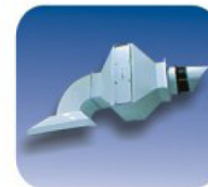
SISTEMA DE EXTRACCIÓN CON UNIDAD DE VENTILACIÓN CSB SISTEMA DE EXTRACCIÓN CON UNIDAD DE VENTILACIÓN Y FILTRO OLORES CSB CAMPANA DE EXTRACCIÓN CSB CON 4 METROS DE DUCTOS