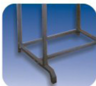
BASE PORTA CABINA TUBULAR