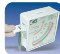
MEDIDOR DE SEGURIDAD