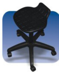
SILLA ERGONÓMICA NEUMÁTICA CON ESPALDAR Y RUEDAS