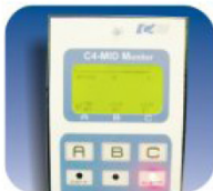
ACCESORIO MID MONITOR (INSTALADO EN FABRICA) C4 MID CONTROL DIGITAL (PARA MODELO FLC DIGITAL)