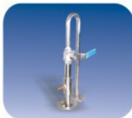
TRAMPA DE VACÍO