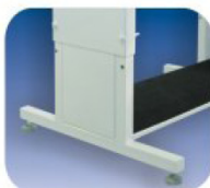
BASE PORTA CABINA TIPO DE LUJO ERGONÓMICA