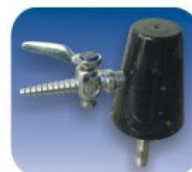
LLAVE DE LUJO PARA VACÍO CON CÓDIGO COLOR.