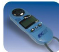
MEDIDOR DE VELOCIDAD FRONTAL.